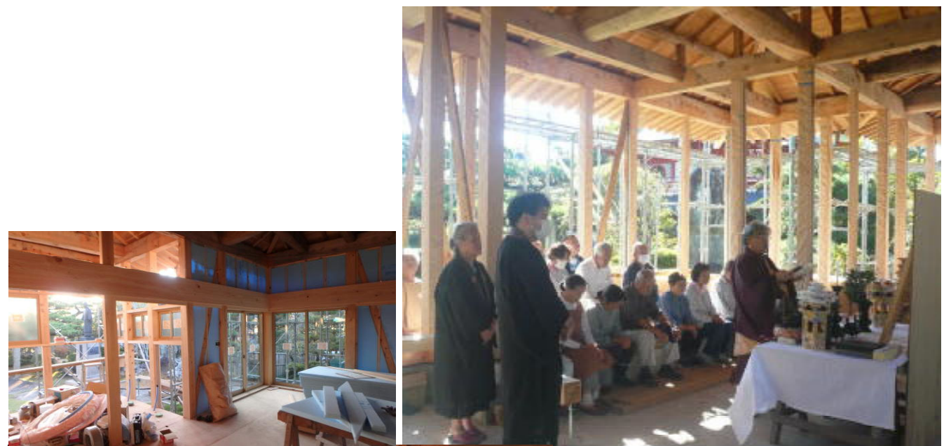
みんなの家、(慈光舎)